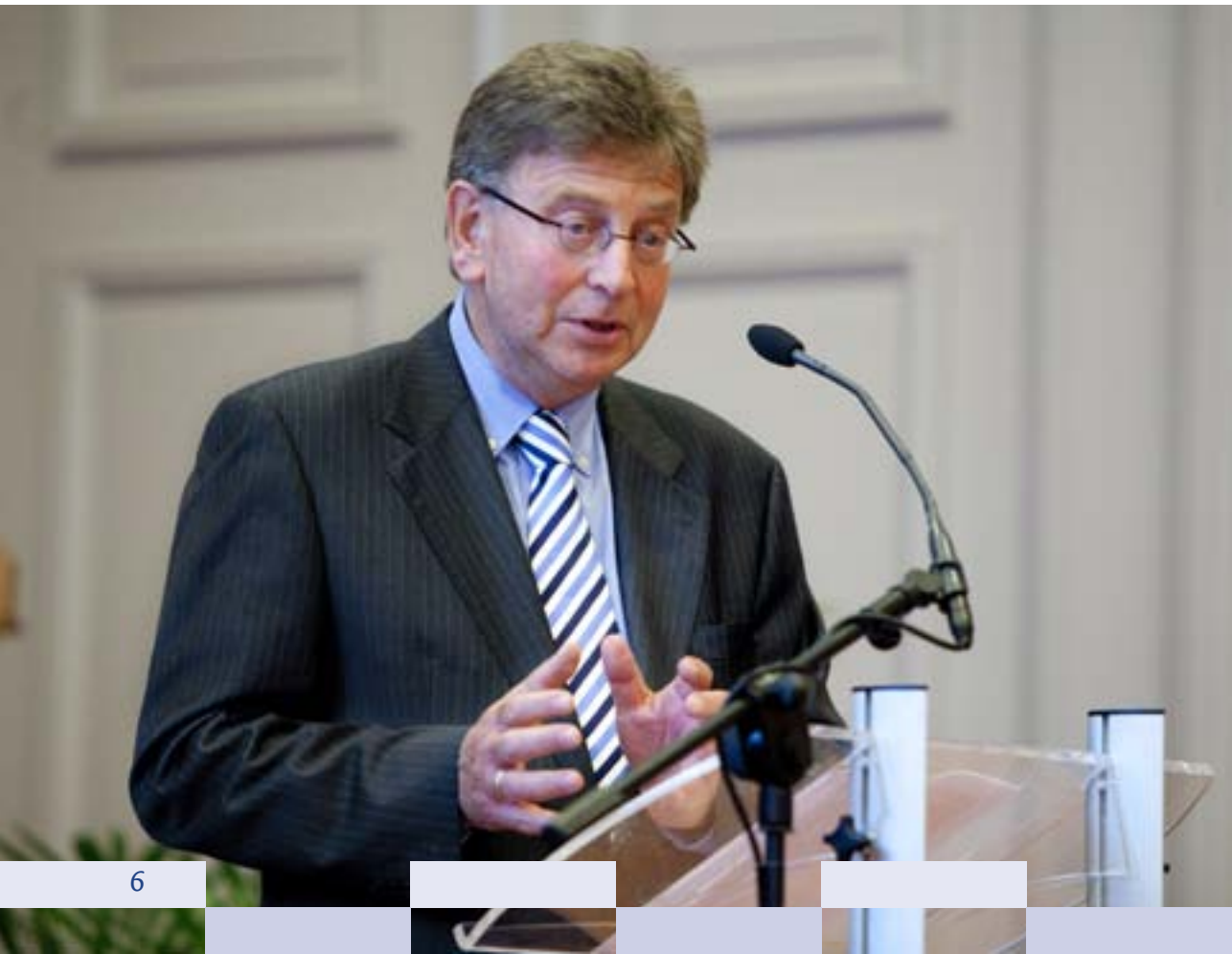
Jacques Wallage, voorzitter van de Raad voor het openbaar bestuur